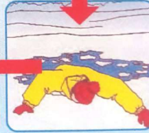
Наползть на лёд, раскинув руки в стороны