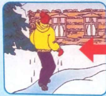
Не отдыхая, бежать к близкому жилью