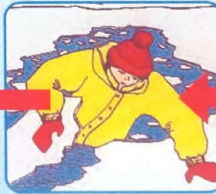
Забросить на лёд ногу, откатиться от полыньи